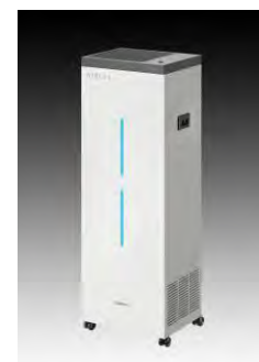
エアアリーア プラス

(製品詳細は https://www.iwasaki.co.jp/optics/sterilization/air/plus.html をご参照ください)